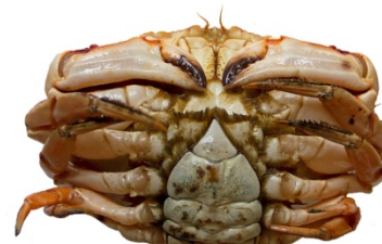
Kvendýr | Female