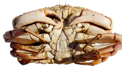
Karldýr | Male