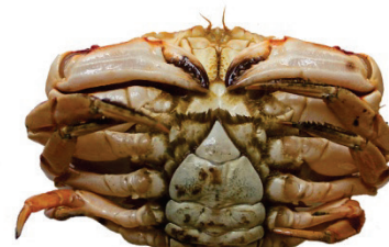
Kvendýr | Female