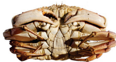
Karldýr | Male